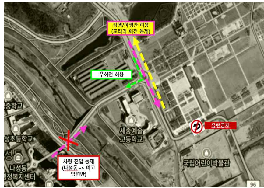
통제시 우회 경로