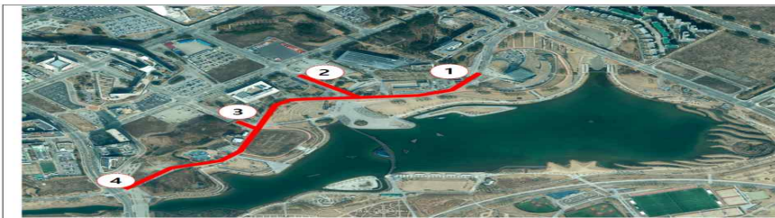
※ (거리) ①↔④ : 1km / ② : 150m / ③ : 40m

A : 세종호수공원 차 없는 거리 10.4.(토)~10.11.(토) / 8일간